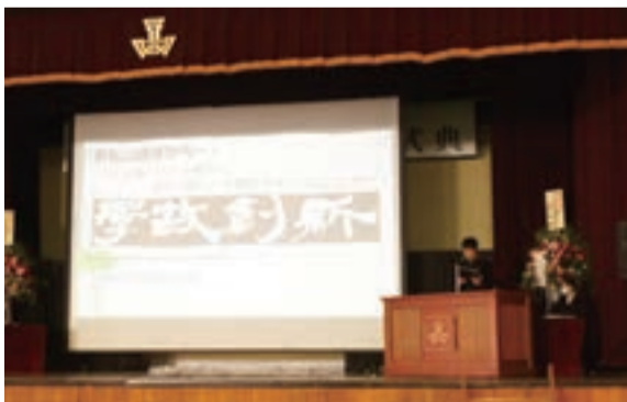
創立110周年記念式典で発表する生徒