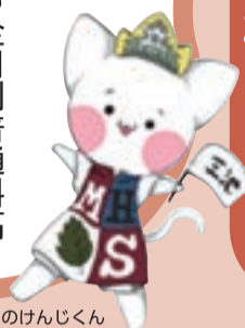
マスコットキャラクターのけんじくん

大正6年2月に福岡県立三池中学校として開校し、今年で創立105年を迎える伝統校です。卒業生は34000人を超え、様々な分野で活躍しています。