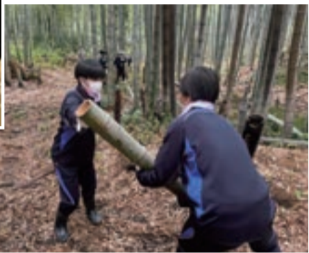
竹林整備をする生徒

この2年間の「若松学」で若松を様々な視点から学び、このまちの賑わいを取り戻すためにはどうしたらよいかを考え、令和4年11月に実施された創立110周年記念式典で、地域の皆様に「未来の若松の在り方」について提案することができました。さっそく市や区の担当者からオファーがあり、生徒たちが創出した「若松の未来の姿」への歩みが始まっています。生徒たちは「人と人との繋がりの大切さを学ぶことができた」、「地域の皆様の若松生に対する愛情を知ることができた」と若松に対するシビックプライド