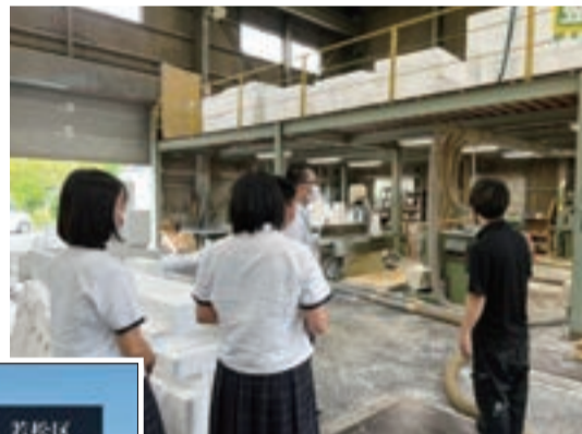
企業を訪問する生徒