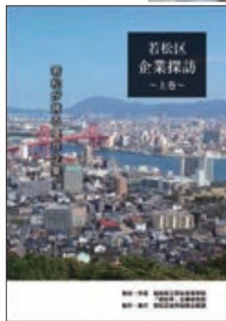
『若松区企業探訪～上巻～』表紙

企業班は、若松にある多くの企業への訪問を通して、企業の魅力を調査研究し、地元の子供たちが地元企業に就職し、各企業とともにこのまちの発展に関わってもらいたいという願いを込めて冊子を作成しました。